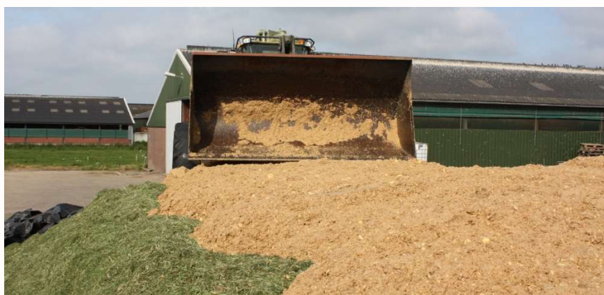
Gluco+ op graskuil

Bel voor meer informatie, een rantsoeninventarisatie, aflevermogelijkheden en/of uw bestelling naar uw vertegenwoordiger of naar onze verkoopbinnendienst, telefoon (0252) 536 146.